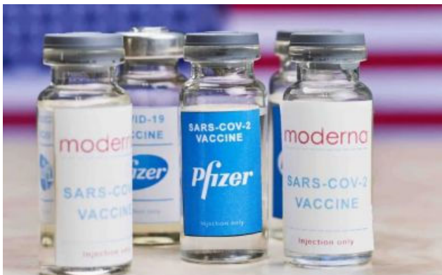
Patentes Covid-19: Pfizer y Moderna preparan sus comparencias ante el Tribunal Superior de Londres