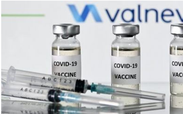
Amplían la vida útil de la vacuna Covid de Valneva tras anunciar que no invertirán en su desarrollo