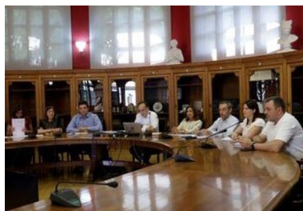
La Cátedra Cajal, en colaboración con la Fundación Merck Salud, convoca ayudas