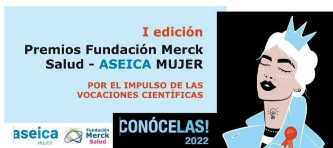
Merck Salud y ASEICA celebran la gala por el impulso de las vocaciones científicas