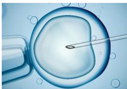
Merck Salud apuesta por el silenciamiento del cromosoma 21 en su Ayuda de