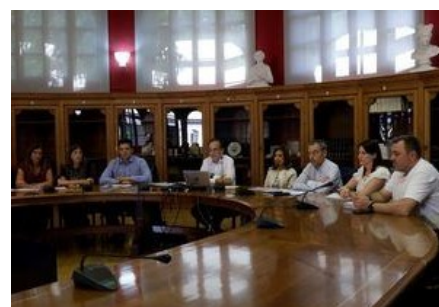
Merck Salud presenta el comité científico de su Cátedra