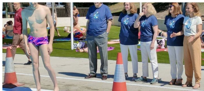
Un total de 24 piscinas de la Comunidad se suman a la campaña 'Mójate por la Esclerosis Múltiple'