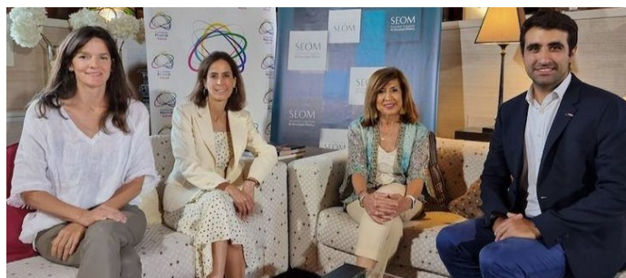
Merck Salud y SEON analizan las necesidades de los pacientes mayores con cáncer