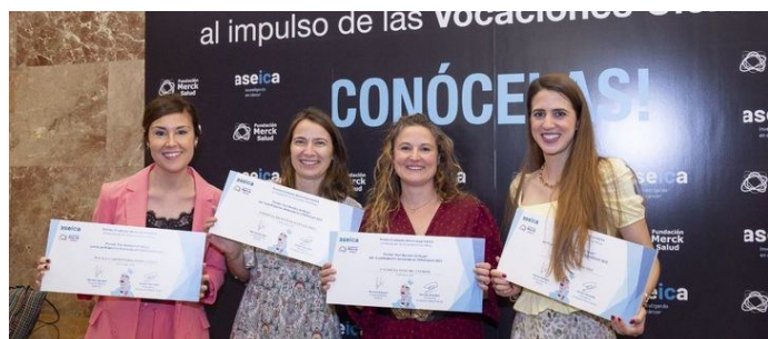
Merck Salud y ASEICA reconocen la labor de 40 investigadoras en los I Premios ‘Con Nombre de Mujer’