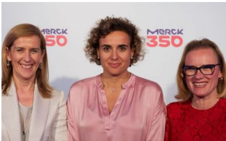
Merck cumple 350 años mirando hacia el futuro