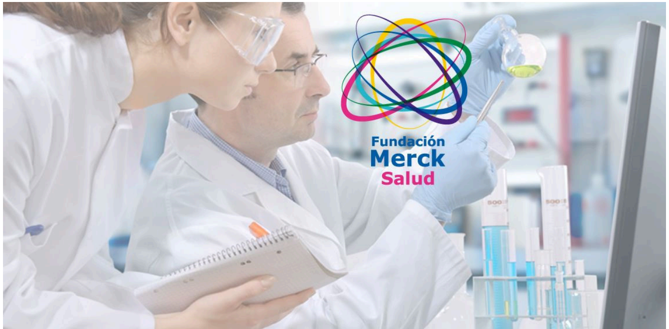
Fundación Merck presenta el Manual de Casos Clínicos en Farmacia Oncológica

La labor del farmacéutico oncológico de hospital como parte de un equipo asistencial es fundamental para garantizar la seguridad de los pacientes, el seguimiento farmacológico y la obtención de los mejores resultados en salud, entre otras cuestiones. Así lo pone de manifiesto el Manual de Casos Clínicos en Farmacia Oncológica , promovido por la Fundación Merck Salud y avalado por la Sociedad Española de Farmacia Hospitalaria (SEFH) bajo la coordinación de Derecho Sanitario Asesores , que ya está disponible para su descarga.