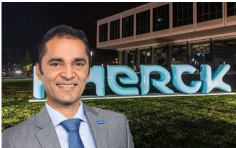
Udit Batra, CEO de Merck Life Science.

Porque salud necesitamos todos... ConSalud.es